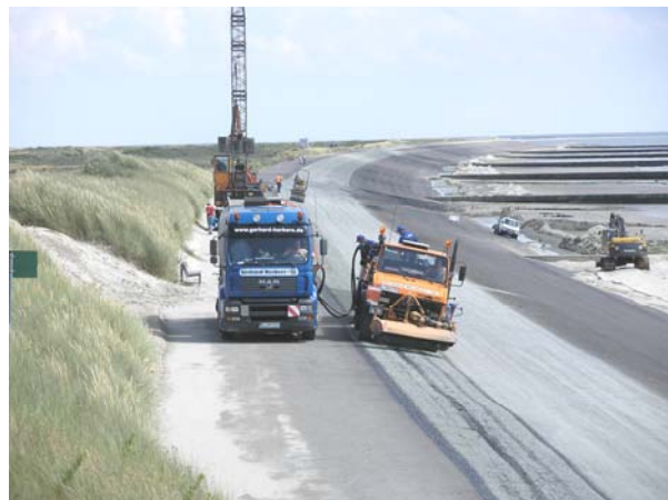
Fertiggestellte seeseitige Asphaltböschung

Die von einer Straßenbau-ARGE mit einem Auftragsvolumen von ca. 1,05 Mio. € ausgeführten Arbeiten konnten noch vor Beginn der Sommerferien 2005 weitestgehend abgeschlossen werden.