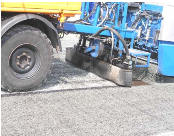
Maschinelles Aufbringen der Versiegelung

Der weniger schadhafte obere Bereich der Böschung wurde aus wirtschaftlichen Gründen nicht mit einer Asphaltdeckschicht abgedeckt, sondern mit einer preiswerteren Bitumenemulsion versiegelt. Die mit Kunststoff modifizierte Bitumenemulsion wurde in zwei Lagen von je 1,5 kg/m 2 Dicke maschinell aufgebracht und mit Edelsplitt 2/5 mm abgestreut und eingewalzt.