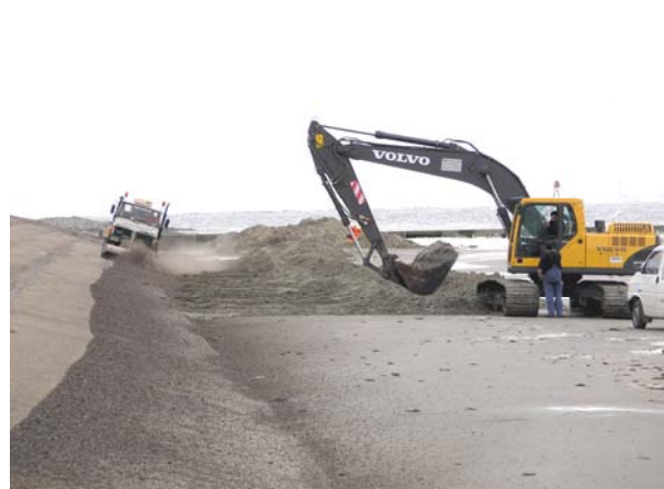
Freilegen und Reinigen der Asphaltoberfläche

Mit jedem Tidehochwasser lagerte sich erneut Sand auf der Asphaltoberfläche ab. Daher waren Reinigungsarbeiten nach jedem Ablauf der Tide im vorgesehenen Asphaltierungsabschnitt erforderlich. Erst danach konnte die im unteren Bereich der Böschung ca. 10 cm dick herzustellende Asphaltenschicht noch vor Eintritt des nächsten Tidehochwassers eingebaut werden. Dafür wurden herkömmliche Straßenfertiger sowie Tandemwalzen eingesetzt.