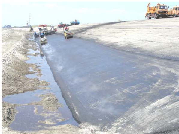
Einbau der unteren 6 m breiten Asphaltbahn

Mit jedem Tidehochwasser lagerte sich erneut Sand auf der Asphaltoberfläche ab. Daher waren Reinigungsarbeiten nach jedem Ablauf der Tide im vorgesehenen Asphaltierungsabschnitt erforderlich. Erst danach konnte die im unteren Bereich der Böschung ca. 10 cm dick herzustellende Asphaltenschicht noch vor Eintritt des nächsten Tidehochwassers eingebaut werden. Dafür wurden herkömmliche Straßenfertiger sowie Tandemwalzen eingesetzt.