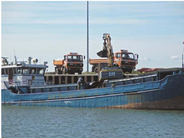
Asphaltumschlag auf LKW

Doch bevor mit den Asphaltierungsarbeiten begonnen werden konnte, musste die gesamte Asphaltoberfläche von Sand und anderen Verunreinigungen mittels Hochdruckwasserstrahlen gereinigt und die offenen Bahnkantenfugen auf der alten Asphaltdecke mit Fugenvergussmasse verfüllt werden.