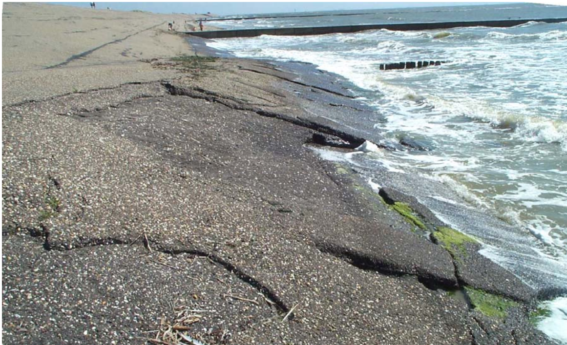
Bauwerksschäden seeseitige Böschung

Der schlechte bauliche Zustand der 1 : 4 geneigten seeseitigen Deckwerksböschung war Veranlassung für eine Grundinstandsetzung der Asphaltabdeckung. Durch Wellen und Seegangsbeanspruchung waren großflächige Abplatzungen, Risse und Auswitterungsschäden an der Asphaltoberfläche entstanden, die in absehbarer Zeit zum Austritt von Kernmaterial führen würden. Dieses sollte durch Aufbringen einer neuen, von 4 cm bis zu 10 cm dicken Asphalttragdeckschicht der Körnung 0/11 mm bzw. 0/16 mm verhindert werden.