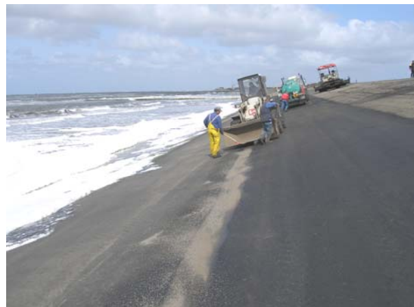
Nahtnachbehandlung bei MThw