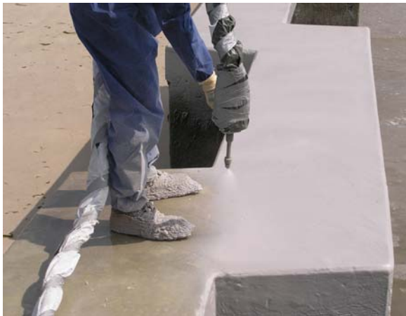
Auftrag der Oberflächenbeschichtung