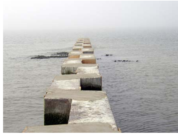
Nach Auffüllung mit PCC-Mörtel