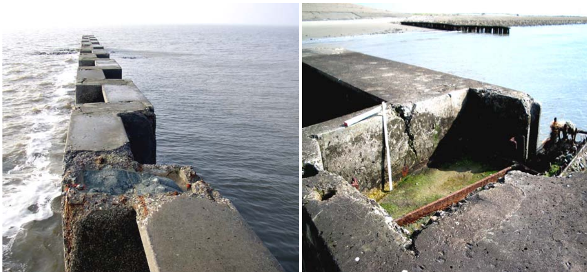
Buhne vor der Instandsetzung

Nach 20-jähriger Standzeit war die Hohlräumverfüllung oberhalb der Tragbohlen durch Risse und Abplatzungen derart beschädigt, dass die Köpfe der Tragbohlen teilweise frei lagen. Eindringende Feuchtigkeit und Frost-Tauwechsel führten bereits zu Abplatzungen an den Stb.-Fertigteilen. Ohne eine Sanierung dieser Bereiche bestand die Gefahr, dass die Einspannbereiche der schweren Stb.-Fertigteile weiter geschwächt und die Buhne insgesamt ihre Standsicherheit verlieren würde.