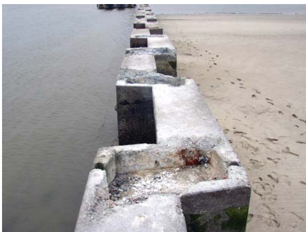
Nach Vorbereitung der Oberfläche

Zuletzt war eine verschleißfeste Oberflächenbeschichtung mit hoher Rissüberbrückungsfähigkeit, auf Basis von Polyharnstoff, in 2-komponentigem Heißsprayverfahren aufzubringen. Aufgrund der schlechten Witterungsbedingungen im Oktober 2004, musste die Ausführung der Oberflächenbeschichtung in den Sommer 2005 verschoben werden.