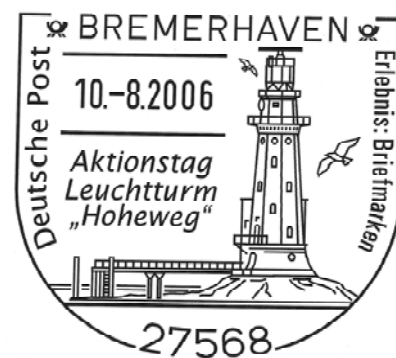
Ersttagsstempel am 10.08.2006