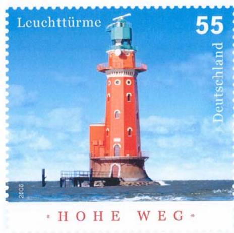
Sonderbriefmarke der Serie "Leuchttürme"

Sonderbriefmarke, Textbeitrag und Ersttagsstempel sind nachfolgend vorgestellt: