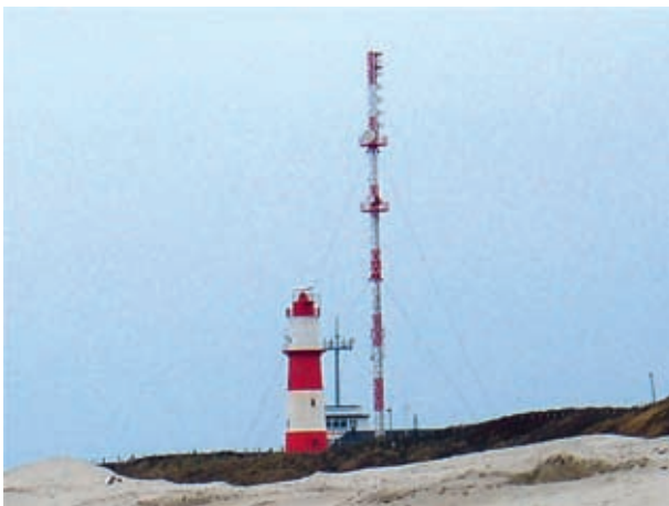
Abb. 2: Gittermast am Borkumer Südstrand

Die Richtfunkstrecke Borkum–Knock wurde Anfang der 70er-Jahre errichtet. Neben der Übertragung von Radardaten werden über diese Strecke weitere wichtige Signale wie UKW-Seefunk, Pegel­daten sowie meteorologische Daten zur Verkehrs­zentrale Ems übermittelt. Auf Borkum dient der Gittermast beim kleinen Leuchtturm in der Süderstraße (Abb. 2) als Antennenträger für die Parabolantennen. Bis zum im Folgenden beschriebenen Umbau waren die landseitigen Antennen dieser Richtfunkstrecke am Radarturm Knock neben der Verkehrs­zentrale Ems montiert (Abb. 3).