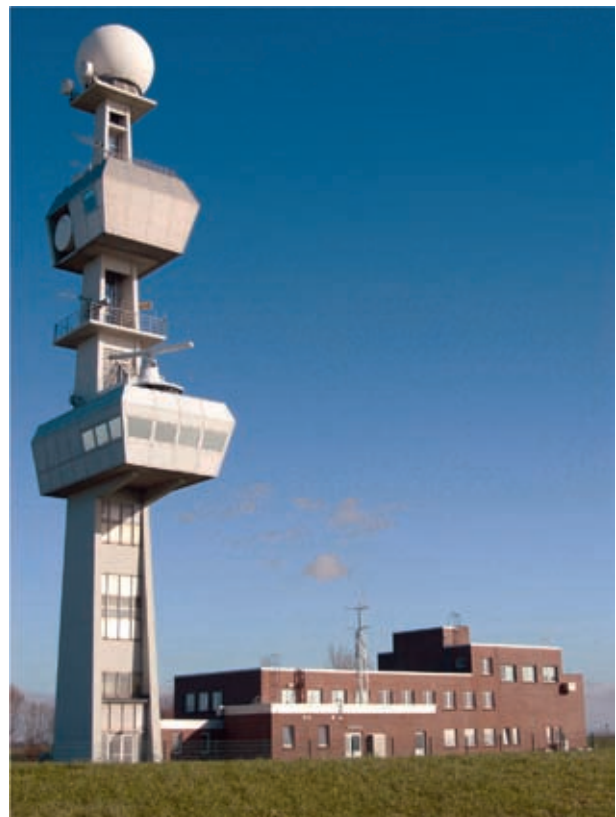
Abb. 3: Verkehrszentrale Ems und Radarturm Knock

Zum Zeitpunkt der Errichtung dieser Richtfunkstrecke erfolgte die Signalübertragung noch in analoger Röhrentechnik. Da die 36 km lange Strecke sowohl über Wasser als auch über Land verlief, wies sie eine Reihe von Besonderheiten auf. Das Streckenverhalten wurde durch die Tide und meteorologische Größen wie