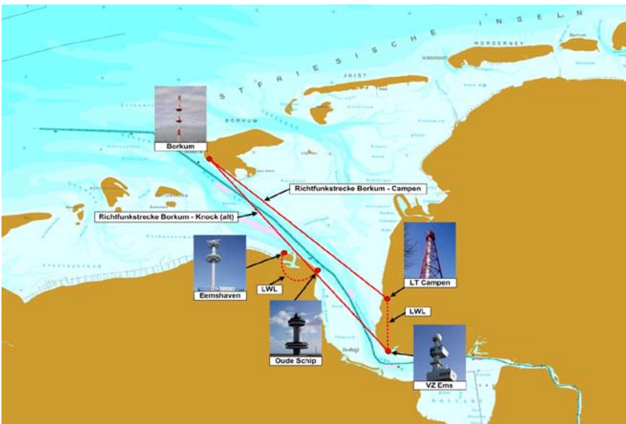
Abb. 5: Richtfunkstrecke mit Lichtwellenleitertrasse

funkstrecke. Dabei wurde das Verursacherprinzip angewendet, d. h. die niederländische Seite, hier der Hafentreiber Groningen Seaports, hatte die gesamten durch den Umbau der Strecke entstehenden Kosten zu tragen. Mitte 2006 wurde eine deutsch-niederländische Arbeitsgruppe gegründet, die mehrere Varianten einer veränderten Signalübertragung von Borkum zur Verkehrszentrale Ems betrachtete und wirtschaftlich bewertete. Als einzig sinnvolle Alternative blieb die Verlegung der Strecke von Borkum zum Campener Leuchtturm und dann die Weiterführung per Glasfaserkabel von Campen zur Verkehrszentrale Ems übrig. Abb. 5 zeigt die veränderte Trassenführung.