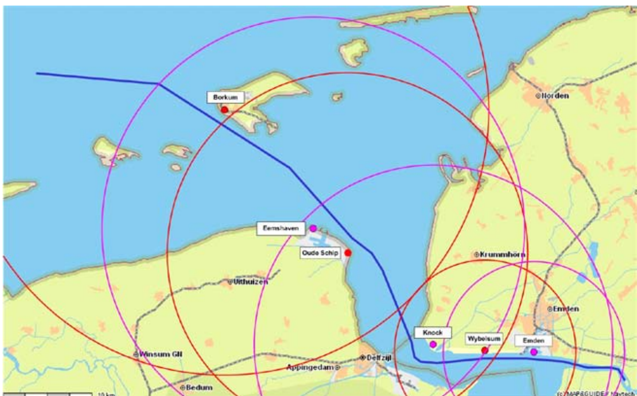
Abb. 1: Darstellung der einzelnen Radarstationen und deren Erfassungsbereiche

Die Datenübertragung von den Radarstationen Borkum, Eemshaven und Oude Schip zur Verkehrszentrale an der Knock erfolgt über Richtfunkstrecken.